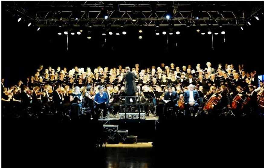
L'ensemble Vocalys (ici en collaboration avec d'autres ensembles lors d'un concert récent) compte sur l'amélioration des protocoles sanitaires pour proposer un nouveau rendez-vous au public en décembre.

Par Jean-François OTT - 03 juil. 2020 à 12:20 - Temps de lecture : 3 min